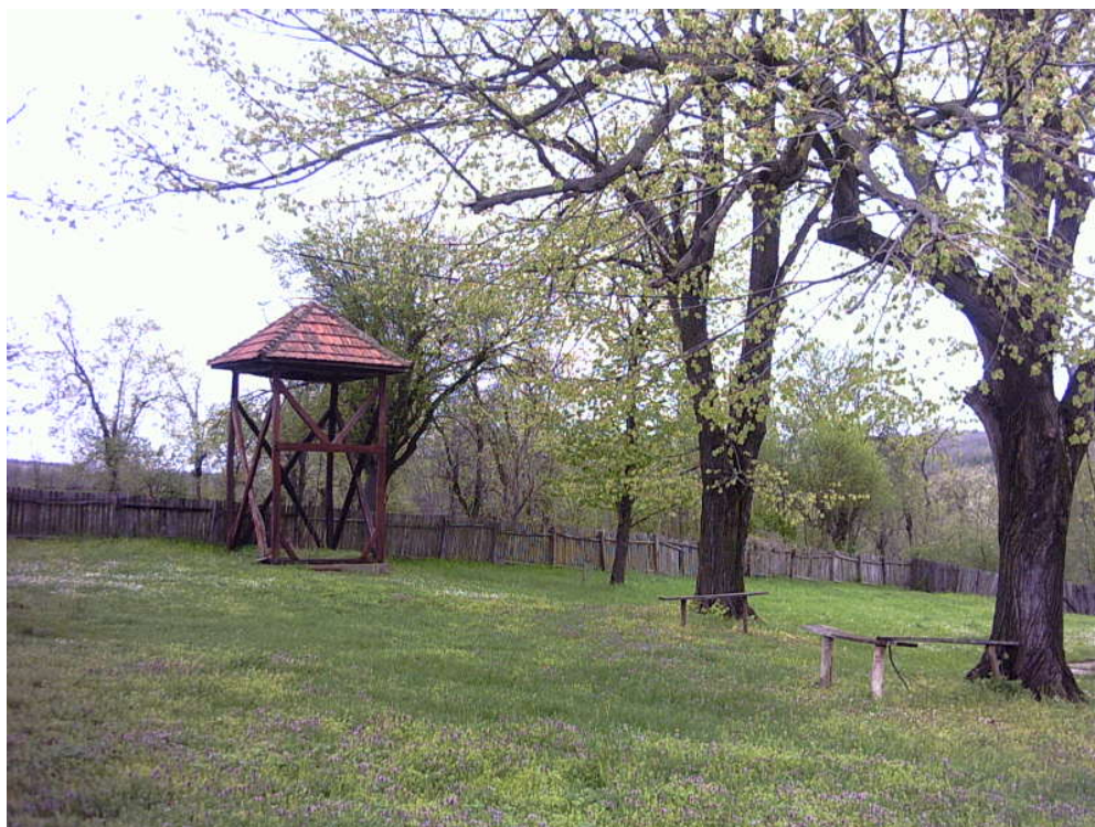
Порта црквине у Ракинцу

У Ракинцу постоји још једно црквиште, на Салавату (број 4 на карти), о коме немамо никаквих података, осим да се у њему служило јутрење младим недељама. 10