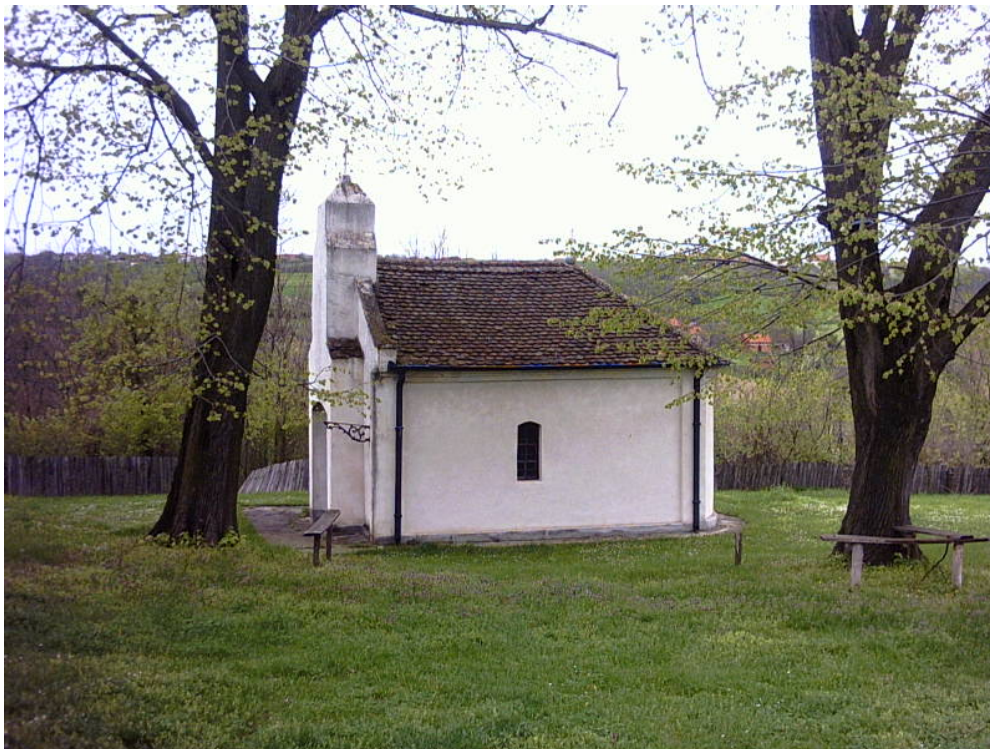
Црквина у Ракинцу