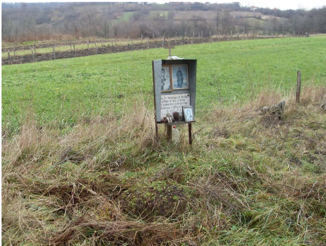
Црквина у Радовању

Стара радовањска црква налазила се у данашњој Црквини, односно у Страхињевици, на имању Ђокића (број 2 на карти). Раније се познавао један црквени зид, а данас се види само разбацано камење, донето са Карауле и из Брзана. Срушену цркву затекли су већ први досељеници почетком XIX века. Академик Јован Ердељановић нашао је 1908. године надгробне плоче на оближњем гробљу, на узвишеној страни (испод садашњег гробља). 7 На жалост, не постоје други подаци о овој цркви коју су научници сврстали у средњовековне цркве. Евентуална истраживања на овом терену пружила би већа сазнања како о цркви тако и о оближњим насељима и гробљу.