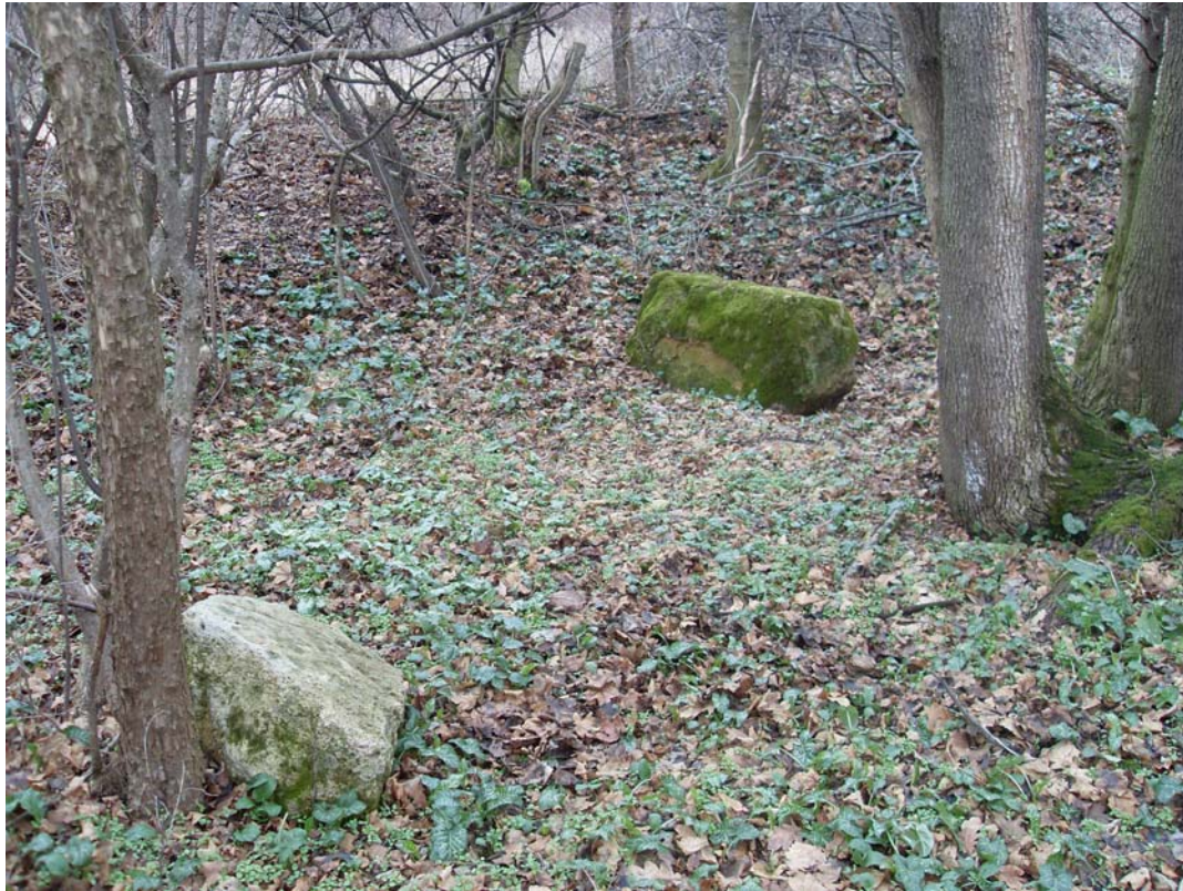
Црквина у Великој Плани