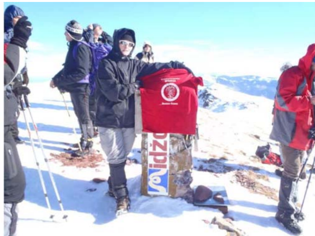
Vrbica na 2.168 mnv

Tih 8 kilometara od vrha, do doma na Babinom zubu, prešli smo za dva ipo sata. Vetar je mestimično bio baš jak, mada nije bilo hladno. U domu smo napravili pauzu da se cela grupa sakupi, jer bilo je tu nekoliko njih koji su uživali u skijanju i šetnji po okolini. Veče smo opet proveli u Mezdreji, gde su nam domaćini ponudili ukusnu večeru i opet živu muziku za prijatnije druženje.