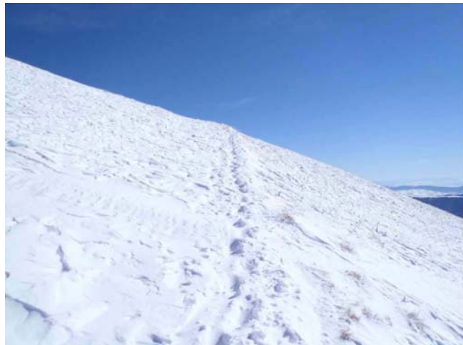
Beo sneg i plavo nebo

Brzo smo napredovali. Nas iz Pobjede bilo je 15, iz Prokuplja 5 planinara i još možda desetak planinara koji su po grupicama peli samostalno. Naša grupa se dosta bila razvukla iz razloga što su neki žurili kondicije radi, dok su drugi uživali, slikali, meditirali u zavetrinama i upijali poglede na okolne planine koji su ovoga dana stvarno bili fenomenalni. To je bio jedan od onih poklonjenih dana koji planina podari upornim planinarima. Zbog takvih dana vredi odlaziti u planinu. Ja sam na vrhu bila u 12 i 45. Mnogi su bili većstigli. Skupili smo se, slikali se, pojeli po nešto, napravili kratku pauzu i krenuli natrag.