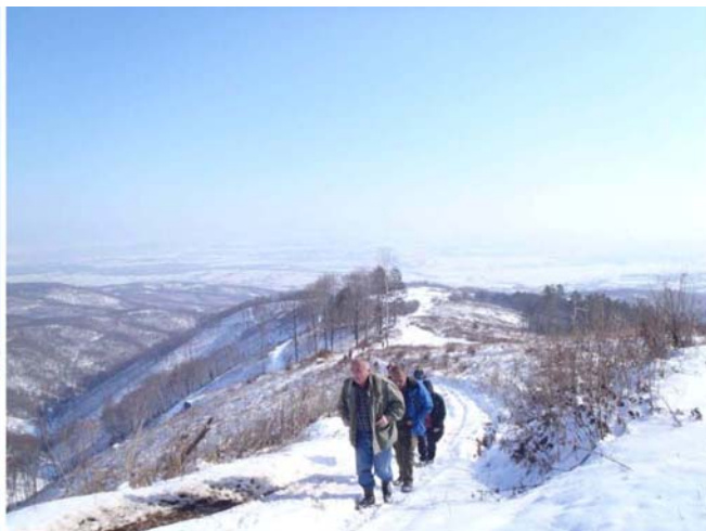
Поглед на гребен којим смо се пели