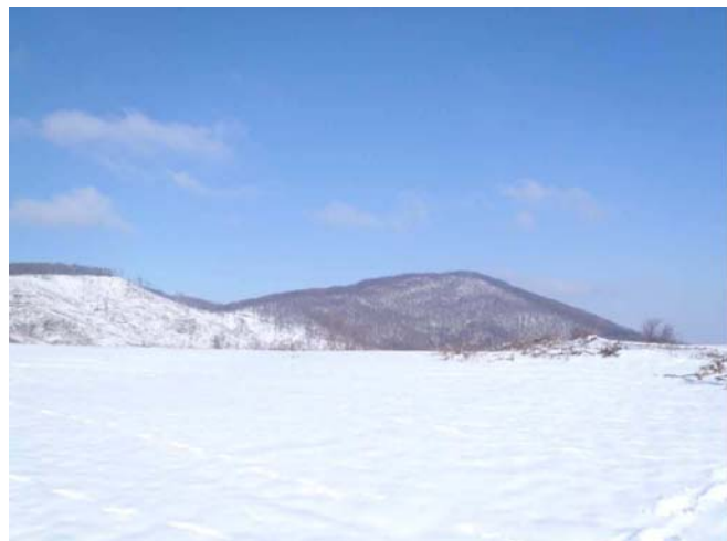
Мали и Велики Ветрен