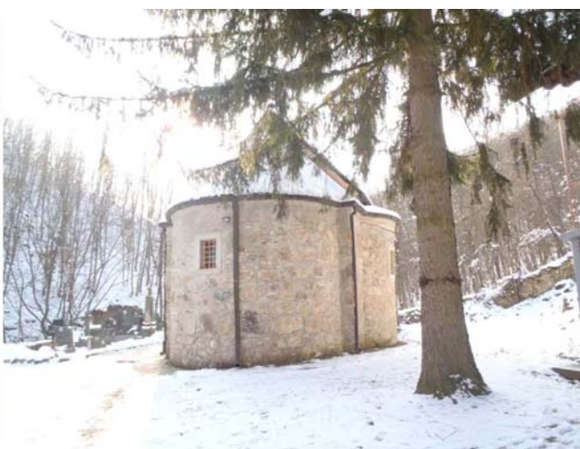
Манастир Свети Никола

По речима организатора, прешли смо око 12 километара, са успоном око 500 м. Већ око пола пет смо били у Великој Плани.