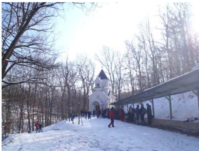
Црква Огњене Марије