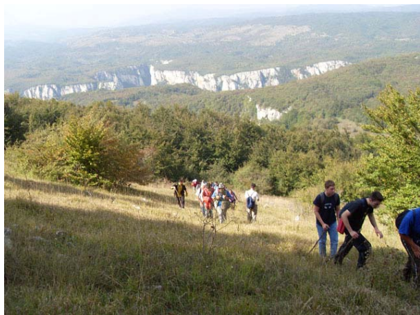
Успон на Малиник

Група која је извела успон на Малиник имала је још бољи поглед на цео Лазарев кањон, али се због громава у даљини, одлучила на ранији спуст, тако да је у Злот стигла око 17:15.