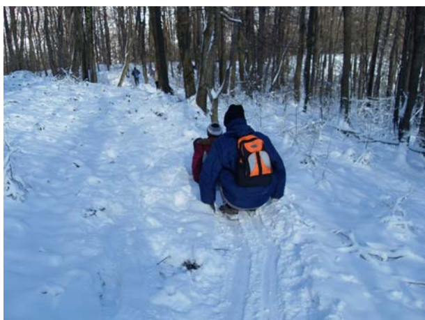
Различити стилови спуста

У повратку, обишли смо и Марићевића јаругу у Орашцу, а затим се вратили у Велику Плану.